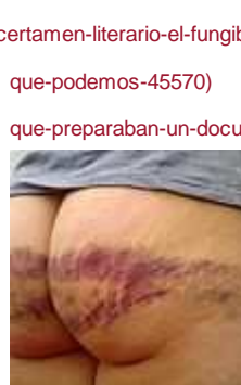
ONU suspende a

( http://periodistas-es.com/certamen-literario-el-fungible-2016-62838 )