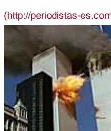
Mueren tres periodistas que preparaban un documental sobre la