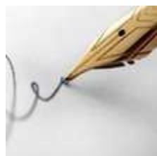
Certamen Literario El Fungible 2016