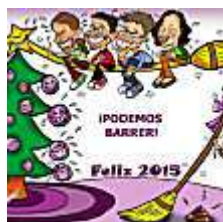
Claro Que Podemos